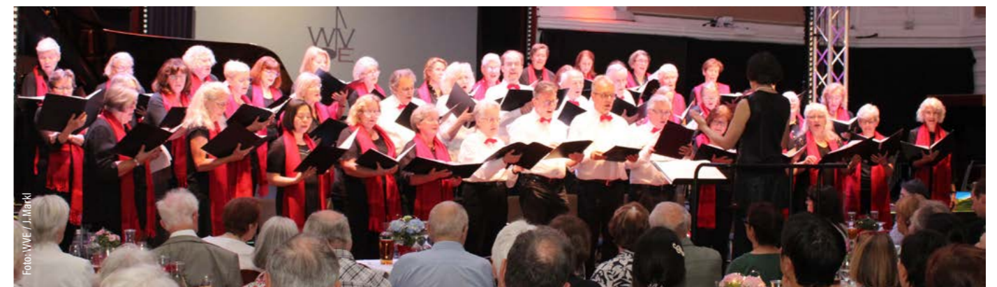
Das Wiener Vokal Ensemble im Gründungsjahr 1955, beim Jubiläumskonzert im Juni 2025 und im Pfarrgarten 2024

Bereits heute freue ich mich darauf, auch im kommenden Schuljahr 2025/26 in und mit der Pfarre Heiligenstadt auch weiterhin schöne Kirchenmusik gemeinsam erleben und gestalten zu können.