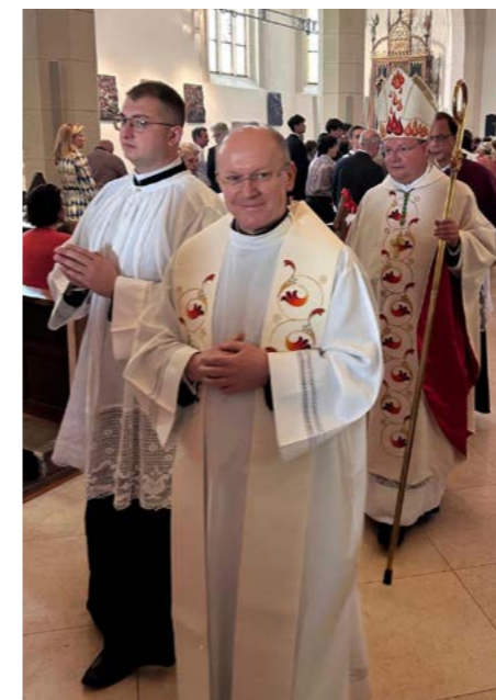
Festlicher Einzug zur Firmung und sichtbare Vorfreude

Nähere Infos unter www.heidemariaoberthuer.com