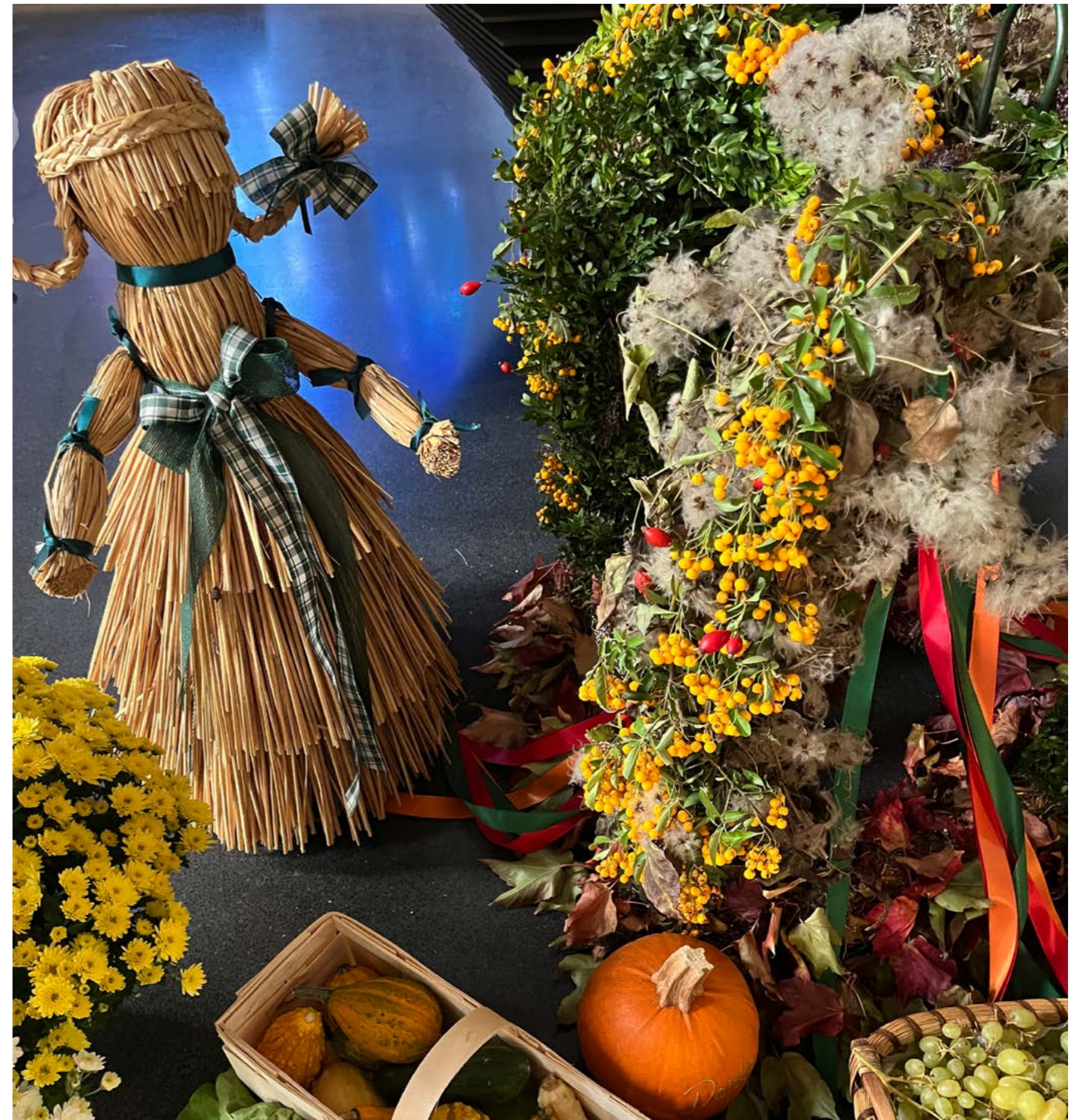
Erntedankschmuck in der Kirche St. Michael (2024)

Beliebt sind auch Festumzüge, in deren Fokus Heuwagen stehen, die mit Obst, Gemüse und Gaben des Herbsts geschmückt sind.