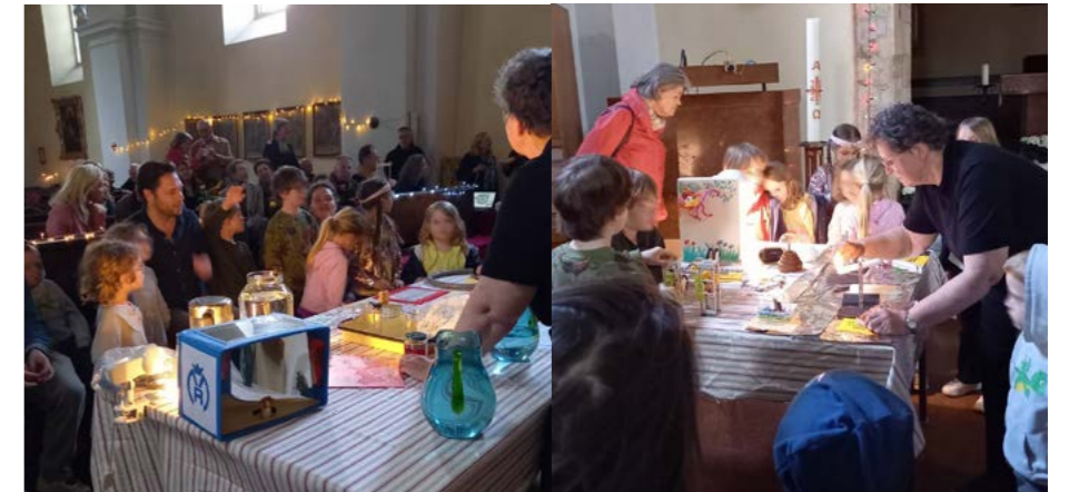
Gute Stimmung bei den Erwachsenen und staunende Kinderaugen, die unsere Kirche St. Jakob zu einem lebendigen Ort der Gemeinschaft machten.