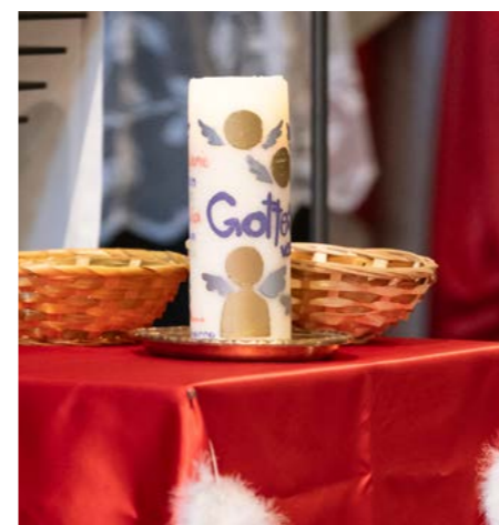
Die Gruppenkerze mit dem Motto „Gottes Geist verleiht Flügel“