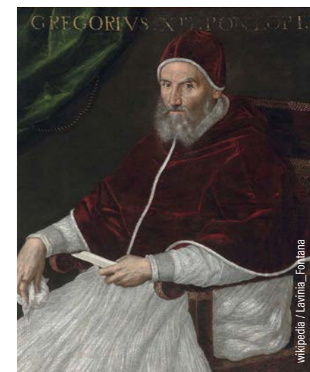
Papst Gregor XIII reformierte den Kalender 1582 mit der päpstlichen Bulle Inter gravissimas

Der „julianische Kalender“ (demzufolge beispielsweise Weihnachten erst am 7. Jänner gefeiert wird), wird bis heute von den Orthodoxen „Alt-Kalendariern“ ver-