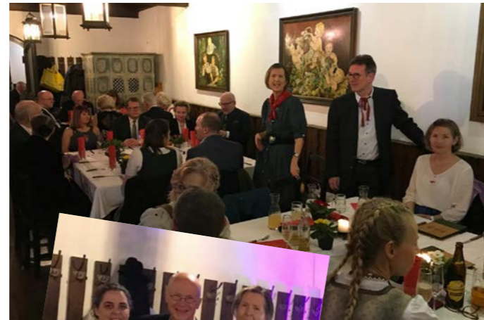
Ausverkauftes Haus beim Feuerwehr-Wagner

Danach zogen alle weiter in den Roman Scholz Saal, wo von unseren Pfarrmitgliedern zwölf verschiedene Suppen vorbereitet worden waren