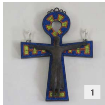
Titelbild: Kreuz aus der Kirche St. Jakob, Heiligenstadt